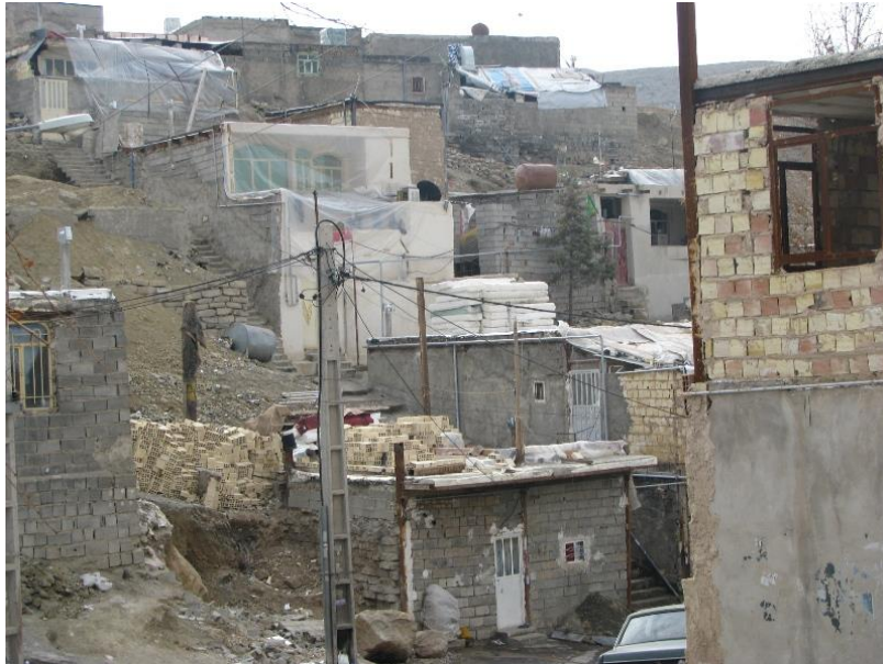
منبع: نگارنده، آذر ماه ۱۳۸۸

مهم‌ترین ویژگی محله تقسیم آن به دو منطقه بالا و پایین است که از سه راه موتور سوار این تقسیم‌بندی آغاز می‌شود. بخش پایینی محل زندگی خانواده‌هایی است که ساکنین اولیه این منطقه هستند، هر چه به سمت قسمت‌های بالایی منطقه پیش می‌رویم از کیفیت ساخت‌وسازها کاسته، خانه‌ها کوچک‌تر شده و گاه به جای شیشه پنجره، از نایلون استفاده می‌شود؛ کوچه‌های بخش بالایی آسفالت نشده‌اند و مرغ و خروس در آنها پرسه می‌زند. در آخرین بخش محله خانه‌هایی است که ساکنان آن لباس‌های محلی می‌پوشند. گاهی در این قسمت ماشین‌های مدل بالا حرکت می‌کنند که متعلق به مشتریان مواد مخدر و مشروبات الکلی هستند. بعضی از اهالی که در بخش پایین زندگی می‌کنند تا به حال به بخش بالایی نرفته‌اند و رفتن به آنجا را خطرناک می‌دانند.