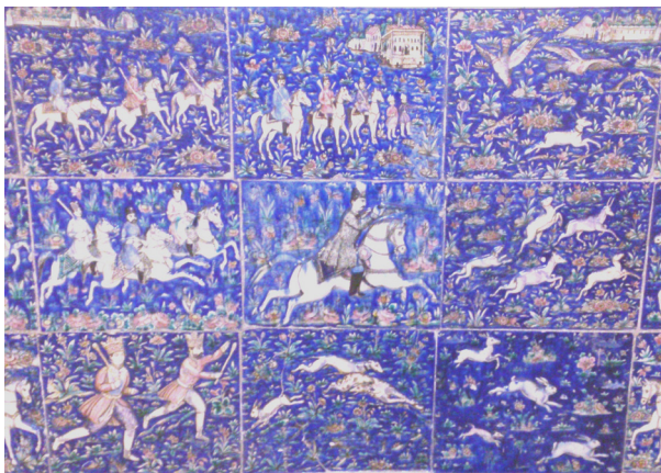
تصویر ۷- کاشی نقش برجسته با تصویر ناصرالدین‌شاه در حال شکار، سرسرای تالار اصلی کاخ گلستان.

تصویرپردازی از مجالس بزمی که در آن عده‌ای خنیاگر به نوازندگی و دست افشانی مشغول هستند، جزء بی بدیل موضوعات این کاشی‌ها است. در صدر مضامین بزمی این کاشی‌ها، مجالس داستان‌های تغزلی همچون لیلی و مجنون، فرهاد و شیرین، بهرام و گلندام، شیخ صنعان و دختر ترسا و بالاتر از همه صحنه‌های شکار و تفریح و تفنن قرار دارد (تصویر ۸).