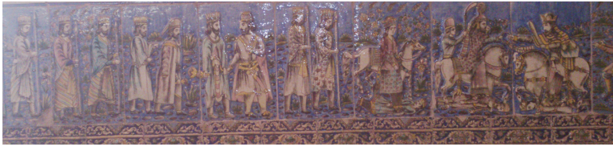
تصویر ۱۳- کاشی نقش برجسته تالار اصلی کاخ گلستان ، نمای کلی از نقش برجسته هخامنشی و ساسانی.

جدول ۱- جامعه آماری کاشی های نقش برجسته تالار اصلی کاخ گلستان به ترتیب زمانی.