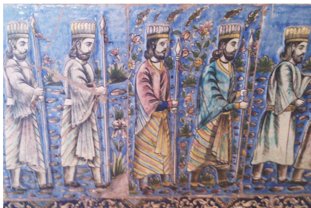
تصویر ۱۱- کاشی نقش برجسته تالار اصلی کاخ گلستان با تصویر سربازان هخامنشی.

توجه به مظاهر فرهنگ و تمدن ایران باستان، رویکرد سیاسی دولت قاجار را تشکیل می‌دهد و تجلی این رویکرد در آثار هنری دوران قاجار به خوبی مشهود است. در حقیقت، تاکید هنر قاجار بر موضوعات مرسوم در هنر ایران باستان، به منظور برابر نهادن اقتدار سیاسی شاهان قاجار با اقتدار سیاسی شاهان باستانی ایران مشروعیت بخشیدن به قدرت حاکم بوده است (آژند، ۱۳۸۵، ۴۱). تلاش‌های متوالی برای مشروعیت بخشیدن به زمان حال از طریق بازسازی هدفمند تاریخ گذشته بارها پایه مشروعیت سلسله‌های حاکم بر ایران قرار گرفته و از پدیده‌های متداول تاریخ این سرزمین محسوب می‌گردد (Bausani, 81, 1977). یک نمونه کاشی نقش برجسته که از دیوارنگاره‌های پلکان شرقی تخت جمشید و همچنین نقش برجسته گرفتن حلقه پادشاهی توسط اردشیر بابکان از هورامزدا در نقش رستم شیراز الگو برداری شده است (تصاویر ۱۱ و ۱۲). قابل ذکر است که شاهان قاجار برای افزایش دامنه تأثیر این آثار، آنها را در جاهایی حکاکی کرده‌اند که یادآور گذشته باستانی ایران، باورهای عامه، یا سنت‌های مذهبی باشد (Lerner, 1991, 33).