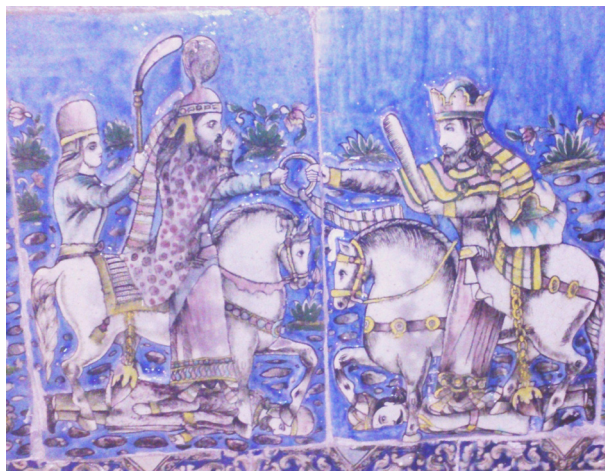
تصویر ۱۲- کاشی نقش برجسته تالار اصلی کاخ گلستان با تصویر گرفتن حلقه پادشاهی توسط اردشیر از هورامزدا.