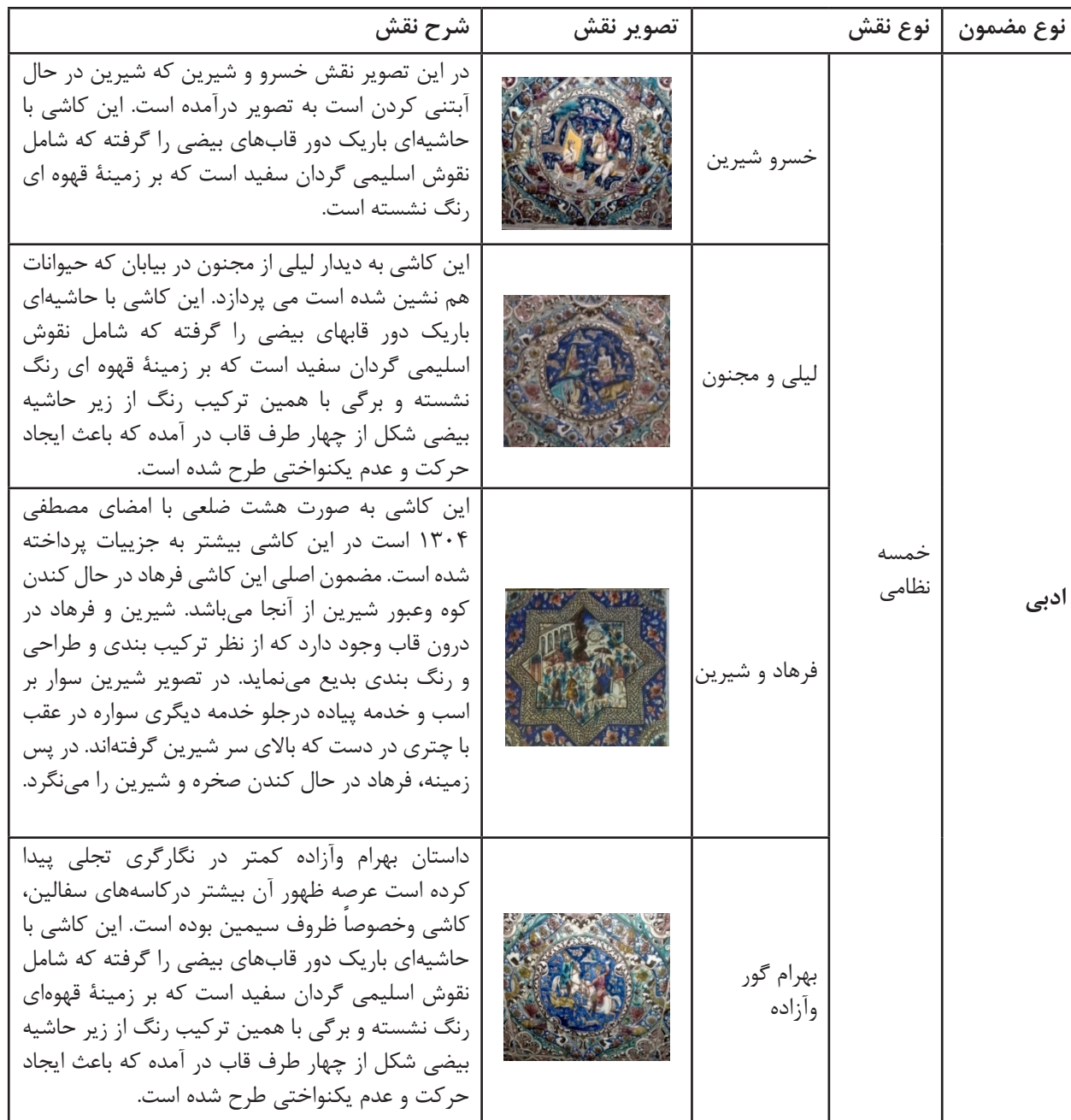
جدول ۲- ویژگی تصاویر کاشی های نقش برجسته سرسرای تالار اصلی کاخ گلستان بر اساس مضامین.