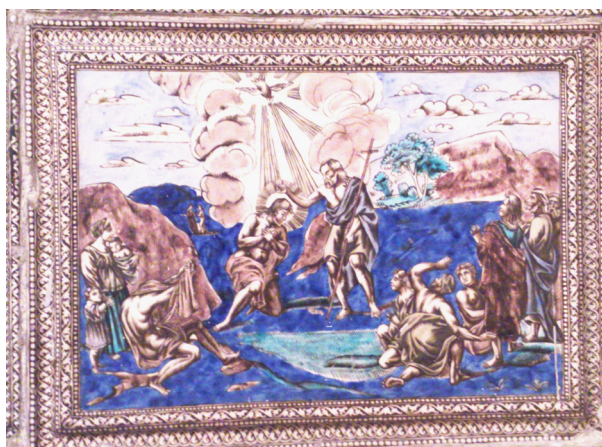
تصویر ۱۰- کاشی نقش برجسته تعمید عیسی (ع) بدست یحیی، سرسرای تالار اصلی کاخ گلستان.