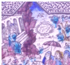
تصویر ۱- کاشی نقش برجسته، سرسرای تالار اصلی کاخ گلستان، با امضا و عمل مصطفی ۱۳۰۴.

با گسترش روابط خارجی و ورود هرچه بیشتر نقاشی‌ها، باسمه‌ها، کارت پستال‌ها و دیگر مصنوعات منقوش اروپایی، توجه