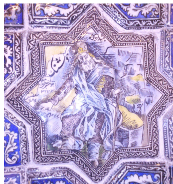
تصویر ۳- راست: کاشی نقش برجسته با تصویر هوشنگ و متن روی کاشی «پیشدادیان، هوشنگ، جلوسش قبل از میلاد ۳۲۲۶۴۰، سلطنتش ۴۰ سال». چپ: تصویر چاپ سنگی هوشنگ از کتاب نامه خسروان اثر جلال‌الدین میرزا.