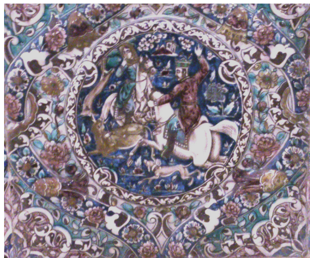
تصویر ۶- کاشی نقش برجسته بهرام گور به همراه آزاده در حال شکار آهو، سرسرای تالار اصلی کاخ گلستان.