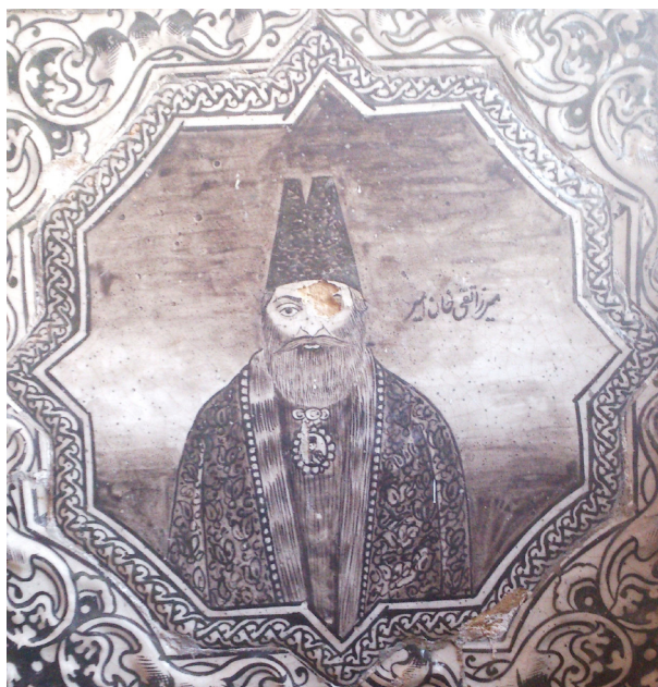
تصویر ۴- کاشی نقش برجسته با تصویر امیر کبیر، سرسرای تالار اصلی کاخ گلستان.

بسیاری از هنرمندان به نقوش طبیعت‌گرایانه اروپایی جلب شده و جنبش فرنگی‌سازی که از دوران صفویه آغاز شده بود، بیش از پیش گسترش یافت (نوایی، ۱۳۸۲، ۱۳). در این دوره، با الگو گرفتن از باسمه‌های وارداتی، مناظر و چهره پردازی‌های کم ارزش اروپایی بر روی کاشی‌ها انجام شده است (فلور و همکاران، ۱۳۸۱، ۲۰-۲۶). از عوامل موثر برجانبش تصویرگری، پیدایش عکس و صنعت عکاسی در ایران است، که موجب شد موضوعات تازه‌ای وارد هنرهای تصویری آن زمان شود (تناولی، ۱۳۶۸، ۱۲). تأثیرپذیری از شاهنامه فردوسی و ایجاد یک حس ملی‌گرایی و تمایل به تقلید از نقوش ایران باستان، تأثیرپذیری از داستان‌های ادبی مانند خمسه نظامی، منطق‌الطیر عطار، جامی، تأثیرپذیری از عکاسی و عکس و چاپ سنگی، الگوگیری از نقش برجسته‌های باقی‌مانده از دوره‌های پیشین، الگوبرداری از آثار و تصاویر وارداتی و تقلید از شیوه کار نقاشان ایرانی آموزش دیده بر اساس اصول نقاشی غرب را از مهم‌ترین عوامل موثر بر روند تصویرگری کاشی‌های نقش برجسته قاجار می‌باشد.