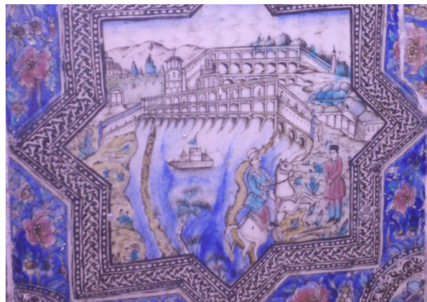
تصویر ۵- کاشی نقش برجسته منظره پل بر روی رودخانه در اروپا، سرسرای تالار اصلی کاخ گلستان.

از موضوعات مورد علاقه هنرمندان ایرانی، تصویرسازی مضامین برگرفته از داستان‌های ادبی از جمله، داستان بهرام گور می‌باشد. در این تصاویر، بهرام سوار بر اسب، در حال شکار آهو به همراه کنیزش، آزاده چنگ نواز به چشم می‌خورد (تصویر ۶).