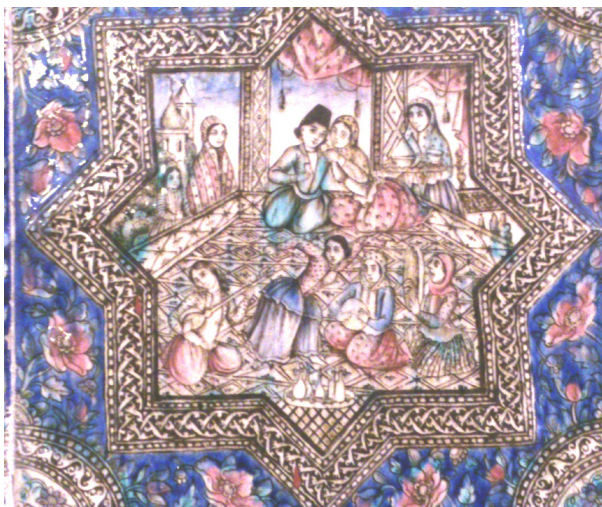
تصویر ۸- کاشی نقش برجسته تصویر بزمی از دوره قاجار، سرسرای تالار اصلی کاخ گلستان.