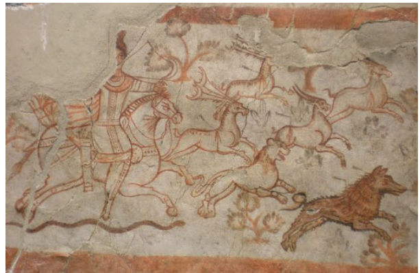
تصویر ۱۲- نقش شکار میترا در نخجیرگاه، فرسک، دورا اروپوس، سوریه.