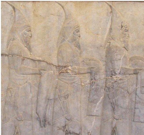
تصویر ۱- الف) گروه نمایندگان سکایی، تخت جمشید، پلکان شرقی آپادانا.

مانند شنل شاپور اول در نقش رستم و یا اردشیر پاپکان در طاق بستان (تصویر ۲) که دنباله‌ی شنل آنها بر روی نقوش برجسته کاملاً مشهود است" (غیبی، ۱۳۸۸، ۲۱۱).