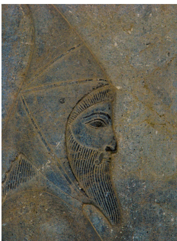
تصویر ۱۷- کلاه سکایی، از قدیمی‌ترین شکل کلاه ایرانی، تخت جمشید.