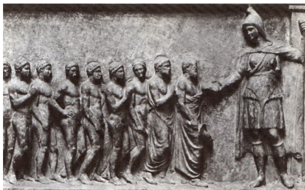
تصویر ۷- آرتیمیس، ایزد جنگاور، مشعلی را دریافت می‌کند.

در مقایسه این تصویر با تصاویر متعددی که از نقش تاورکتونی بدست آمده است (تصویر ۹)، در نهایت می‌توان چنین