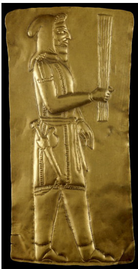
تصویر ۳- پلاک طلایی برسم بر دست، گنجینه ی جیحون، قرن هفتم تا ششم ق.م، موزه ی بریتانیا.

قوم ماد را به ما نشان می دهد. یکی از زیباترین نقوشی که در آن پوشش اقوام ایرانی بر ما نمایانده شده است، نقش برجسته‌ای مربوط به دوره هخامنشیان در تخت جمشید است که ملل هدیه آورنده را به تصویر کشیده است و این نقش، آیینی تمام نمای پوشاک اقوام است و تا حدودی ما را در ادامه یاری خواهد کرد (تصویر ۱). در تصویر الف، نمایندگان سکا و در تصویر ب، نمایندگان ماد به عنوان بخشی از نقش برجسته قابل مشاهده است. الزام این مقاله در ذکر این نقش برجسته، ردیابی پوشش میترا در نقوش بدست آمده و تطبیق آن با پوشاک ایرانی است.