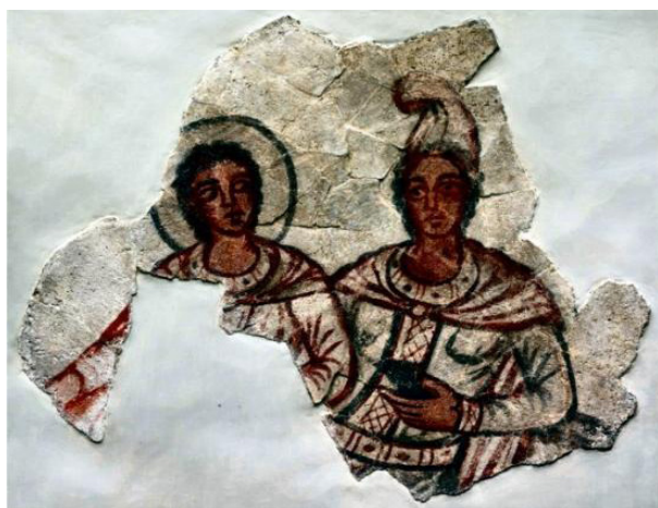
تصویر ۱۹- میترا به همراه سل، دورا اورپوس.

مارونی ها آن را بر سر می گذارند" (مقدم، ۱۳۸۸، ۷۳). امروزه نیز این کلاه به عنوان کلاه پاپ و کاردینال های کاتولیک نقش بازی می کند و اسقف ها نیز در مراسم رسمی خود از آن استفاده می کنند. پس به طور کلی می توان این چنین عنوان کرد که کلاهی که در ایران زمین معرف اقوام بود، به شکلی از طریق آیین میتراپی به اروپا راه یافت و اگرچه این آیین در ادامه و رشد مسیحیت از حرکت باز ماند، اما تجلیات بیرونی آن که یکی از آنها کلاه فریجی است، هم اکنون نیز به عنوان یادگاری از ایران در فرهنگ غربی به جای مانده است.