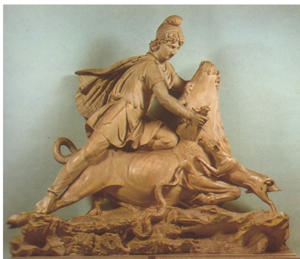
تصویر ۹- میترا در حال قربانی کردن گاو (تاورکتونی)، موزه واتیکان، ایتالیا.

اشکانی که آئین مهر به اروپا راه یافت، با آن همراه شد و با توجه به سالم ماندن آثار میترائیسم در اروپا، امروزه تأثیر آن را بر این مجسمه‌ها می‌توان مشاهده کرد.