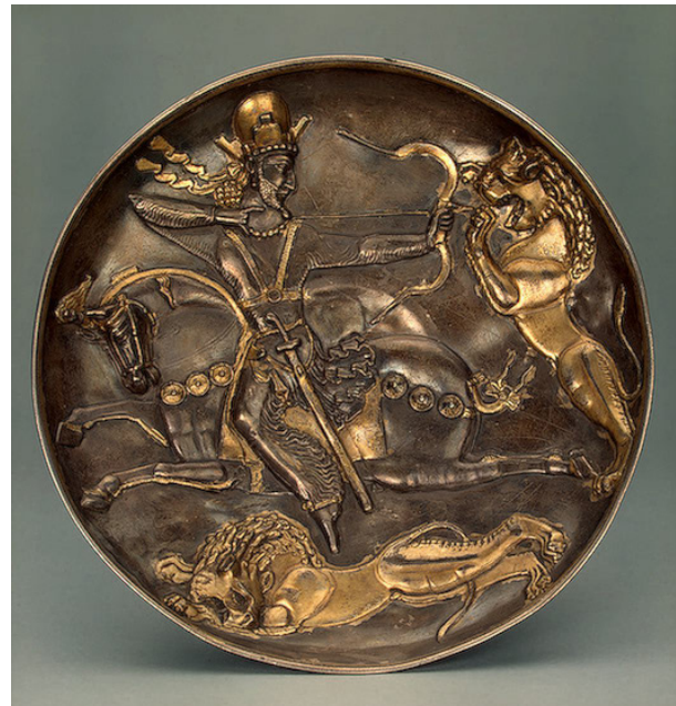
تصویر ۴- بشقاب شاپور دوم در حال شکار شیر، موزه‌ی آرمیتاژ.

از زیباترین پوشاک دوره ساسانی، شلواری است که در بیشتر نقوش برجسته‌ی این دوره با توجه خاصی همراه جزئیات به دیواره‌های سنگی حک شده است. البته با توجه به تصاویر بدست آمده از نقوش برجسته و ظروف فلزی (تصویر ۴) و مقایسه این تصاویر با گذشته می‌توان دریافت که ساسانیان تا حدی میراث‌دار اقوام حاکم پیش از خود بر این سرزمین در دوران گذشته بوده‌اند (تصویر ۳). شلواری که ایزد مهر پوشیده است، شلواری