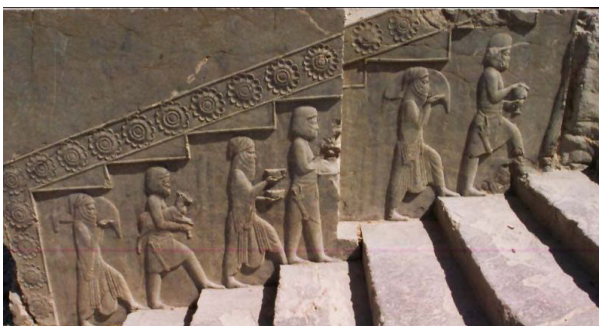
تصویر ۱۶- پلکان شرقی آپادانا، ملل هدیه آورنده، تخت جمشید.