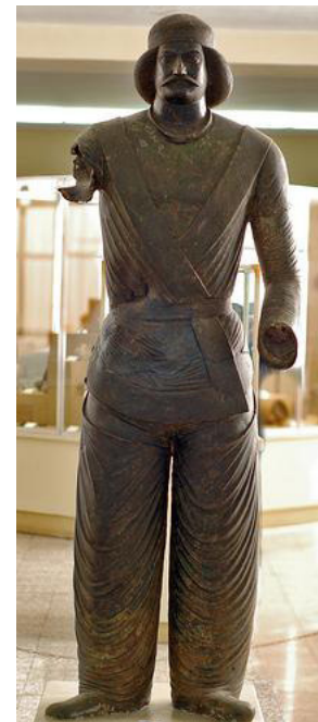
تصویر ۵- مجسمه‌ی نجیب‌زاده‌ی اشکانی، منطقه‌ی شمی، سده‌ی دوم ق.م، موزه ایران باستان.