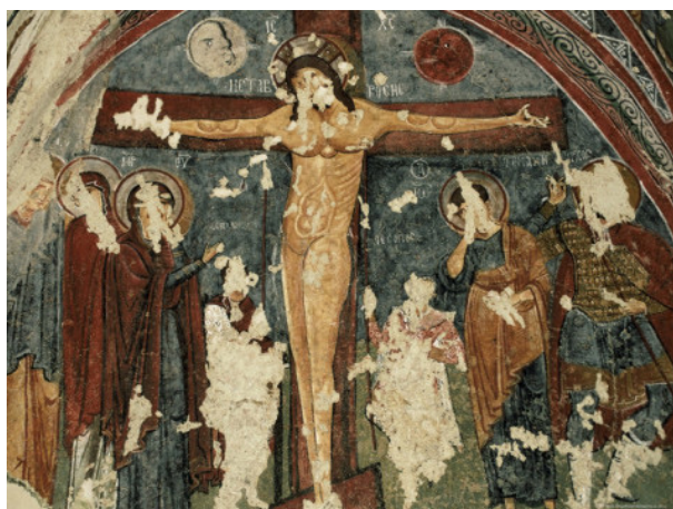
تصویر ۱۳- تصلیب عیسی مسیح، فرسک، کاپادوکیه.

یکی دیگر از پوشش‌هایی که در میترائیسم یا آیین مهر همواره به عنوان یک ویژگی مطرح بوده است، کلاه مهر یا میترا موسوم به کلاه فریجی بوده است. از دیر باز سرپوش به عنوان یکی از مهم‌ترین پوشش‌های ایرانی بوده است. نمونه‌های اولیه آن کلاه‌هایی است که اقوام ایرانی ماد، پارت و پارس همواره بر سر داشتند. "کلاه نزد قوم ماد گذشته از پوشاندن سر و صورت در مقابل سرما و گرما جنبه‌ی آرایشی و نمایشی نیز داشته است: جنبه‌ی نمایشی آن به ویژه در دوران فرمانروایی این قوم و پارس‌ها بیش تر به چشم می‌خورد" (غیبی، ۱۳۸۸، ۸۶).