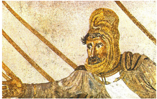
تصویر ۱۰- داریوش هخامنشی، موزاییک نبرد اسکندر و ایرانیان، موزاییک، موزه ملی ناپل، ایتالیا.

نتیجه‌گیری کرد که میترای غربی همان ایزد مهر ایرانی است چرا که پوششی ایرانی به تن دارد و این پوشش همان پوششی است که در دوران متفاوتی در ایران مورد استفاده بوده است. این لباس شامل شلوار، پیراهن که دارای چین خوردگی به نشانه‌ی