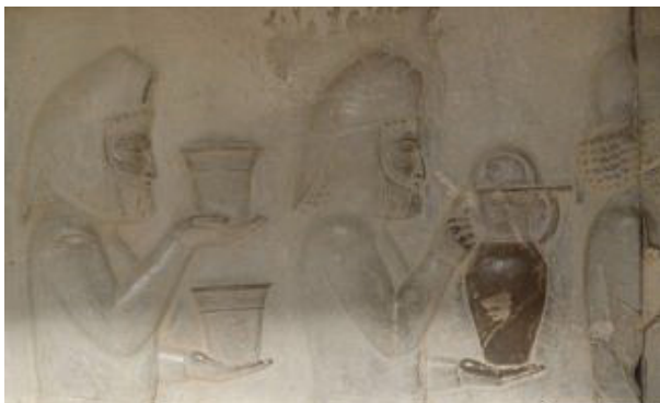
ب) گروه نمایندگان مادی در حال آوردن هدایا، تخت جمشید پلکان شرقی آپادانا، قرن ششم تا پنجم ق.م.