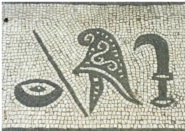
تصویر ۲۰- موزاییک بدست آمده از منطقه ی اوستیا، مرتبه هفتم آئین تشریف میترا، مقام پدر.