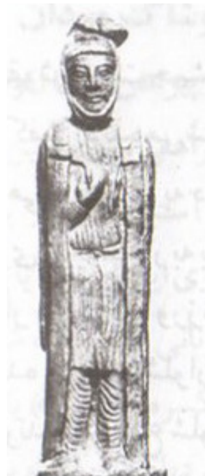
تصویر ۶- مجسمه‌ی نقره‌ای مرد مادی، موزه‌ی برلین (موزه استاتلیش).

ماخذ: (سایت: www.shahnameh.ir ) (غیبی، ۱۳۸۸، ۸۵)