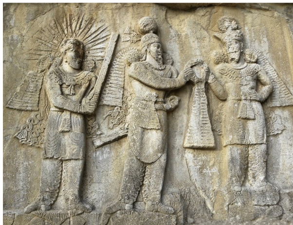
تصویر ۲- تصویر اعطای مقام شاهی در سنگ نگاره ی طاق بستان، سده چهارم میلادی.

بی شک یکی از مهم‌ترین وجوهی که از آن می توان به ماهیت ایرانی ایزد مهر یا میترای غربی پی برد، پوشاک اوست که در این بخش به بررسی و تحلیل آن خواهیم پرداخت. از قدیمی‌ترین نقوشی که در ایران مربوط به ایزد مهر است، نقشی است که در طاق بستان وجود دارد و می توان آن را یکی از محدود نقش برجسته‌های بر جای مانده در ایران دانست که مهر در آن به روشنی نقش بسته است. در این نقش برجسته، ایزد مهر لباسی بر تن دارد که نوعی لباس رایج در دوره ساسانی است. این لباس شامل شلوار چین داری است که به نوعی شباهت به شلوارهای دوره سلوکی و اشکانی دارد، در این نقش اهورامزدا در حال اعطای مقام شاهی به پادشاه است. "در این نقش برجسته هر دو شلوار به پا دارند که از جانب داخل پا چین خورده و به وسیله‌ی بندی به مچ پا چسبیده و هر یک کمر بند و گردن بند و دستبندهایی دارند" (کریستینسن، ۱۳۸۸، ۱۸۷). بالا پوش آن تا بالای زانو بوده بروی آن شالی بسته شده است و بر روی بالا پوش شنلی وجود دارد که یکی از اجزایی است که در نقوش این دوره به چشم می خورد. "ساسانیان گاهی از شنل به عنوان لباس رو و لباسی که نشانه‌ی اشرافیت و پادشاهی بود، استفاده می کردند،