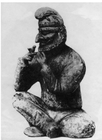
تصویر ۱۸- کلاه سکایی، از قدیمی‌ترین شکل کلاه ایرانی، تخت جمشید. ماخذ: (مقدم، ۱۳۸۸، ۱۶۹)