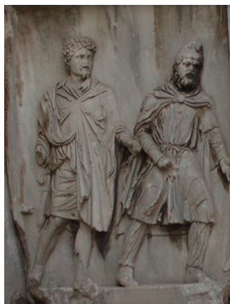
تصویر ۸- مرد پارسی در اسارت سرباز رومی نقش شده بر قوس سپتسموس سوروس، ۲۰۰ میلادی، رم.