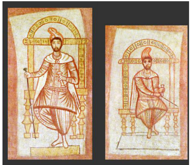
تصویر ۱۱- مرد پارتی، قاب دیواری، فرسک، دورا اروپوس، گالری هنرهای زیبا دانشگاه ییل.