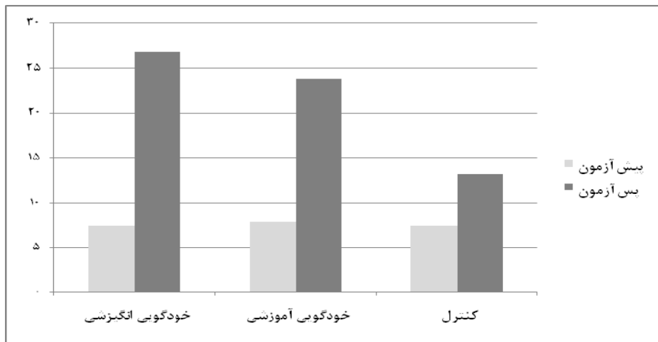
شکل ۱ - عملکرد آزمودنی‌ها در پیش‌آزمون و پس‌آزمون تکلیف تعادل ایستا