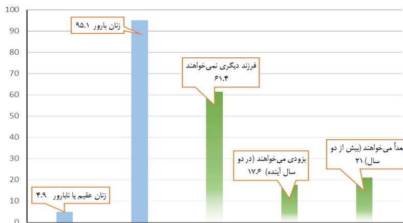
شکل ۱. توزیع زنان بر حسب وضعیت عقیمی و تمایلات فرزندآوری

جدول ۲ تمایلات باروری زنان را بر حسب تعداد فرزندان در حال حاضر زنده نشان می‌دهد. زنانی که فرزندی نداشته‌اند یا دارای یک فرزند بوده‌اند، به صورتی تقریباً مساوی در میان سه طبقه‌ی تمایلات باروری توزیع شده‌اند، با این حال بیشتر آن‌ها (۳۹/۳ درصد) اعلام کرده‌اند که فرزند دیگری نمی‌خواهند. این شرایط در مورد دیگر طبقات تعداد فرزندان نیز صدق می‌کند؛ به طوری که بیشتر زنان دارای دو تا سه فرزند (۷۷/۷ درصد) و یا بیش از سه فرزند (۸۶ درصد) نیز اعلام کرده‌اند که تمایلی به داشتن فرزند دیگر ندارند. ۳۲/۲ درصد زنانی که فرزندی نداشته یا دارای یک فرزند بوده‌اند اعلام کرده‌اند که قصد دارند در دو سال آینده بچه‌دار شوند، ولی این نسبت در میان زنان دارای بیش از سه فرزند تنها ۳/۵ درصد بوده است. در مجموع، می‌توان گفت که بیشتر پاسخ‌گویان تمایلی به داشتن فرزند بیشتر ندارند، اگرچه زنان بدون فرزند یا یک فرزند، بیش از دیگر زنان تمایل مثبت خود را نسبت به داشتن فرزندان دیگر ابراز کرده‌اند.