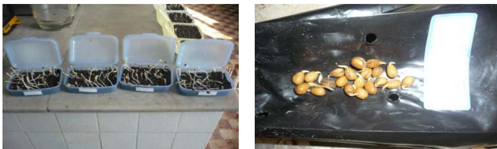
شکل ۲- جوانه زنی بذر محلب تحت تأثیر تیمار استراتیفه سرد