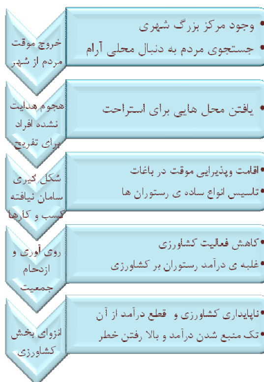
شکل ۲- فرایند شکل‌گیری باغ‌رستوران‌های دره فرحزاد

Tehran 9Municipality, 2district, 2010 and authors' fieldwork.