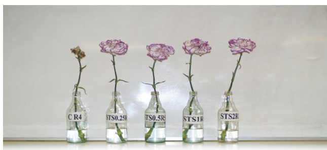
شکل ۱- تاثیر غلظت‌های مختلف تیوسولفات نقره بر طول عمر گل‌دانی گل بریده میخک رقم تمپو در مقایسه با شاهد، از چپ به راست شاهد (C)، تیوسولفات نقره (STS) با غلظت‌های ۰/۲۵، ۰/۵، ۱ و ۲ میلی‌مولار

در بین تیمارهای مورد آزمایش غلظت‌های مختلف تیوسولفات نقره به خصوص غلظت‌های ۰/۲۵ و ۰/۵ میلی‌مولار به ترتیب ۲۴/۶۷ و ۲۳/۶۷ روز طول عمر گل میخک رقم تمپو را در مقایسه با شاهد (۱۵/۸۳ روز)