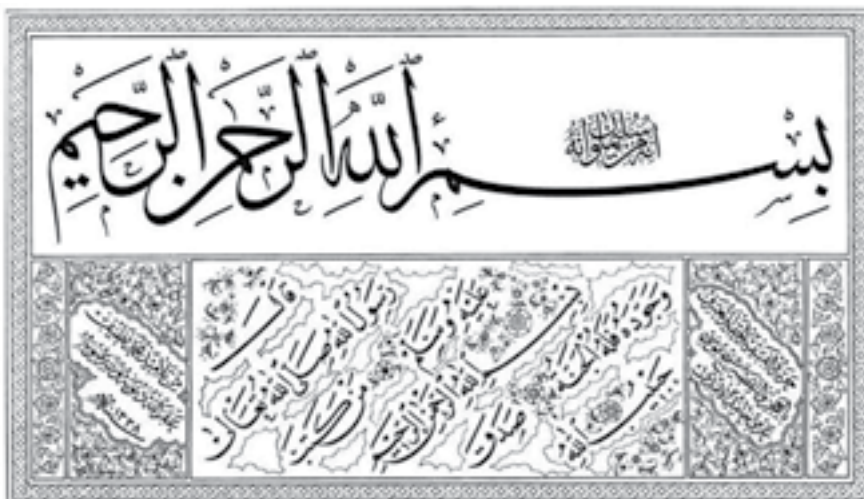
تصویر ۱- اجازه‌نامه حامدالامدی. ترجمه‌ی اجازه‌نامه: اجازه ستاند از استاد خود شیخ موسی حامدالامدی، از شاگردان محمد نضیف که خداوند گناهاش ببخشد و عیوبش ببوشاند، سنه ۱۳۳۸.

دلایل گوناگون داشت. خوشنویسان عثمانی حقیقتاً باور داشتند که بخشی از سلسله‌ی استادان این هنرند. سلسله‌ای که به شیخ حمدالله و پیش از او بازمی‌گشت. ذکر نام استاد در رقم، نشان از این داشت که خطاط از کدام کس کسب اجازه کرده است. اما این رابطه چیزی فراتر و پیچیده‌تر از رابطه‌ی عادی شاگرد و استاد بود. در این رابطه، تنها فن و مهارت تدریس نمی‌شد، بل در این فرایند، شاگردان راه عالمانه و آدمیانه زیستن را نیز از استاد فرامی‌گرفتند» (صفوت، ۱۳۷۹، ۴۰).