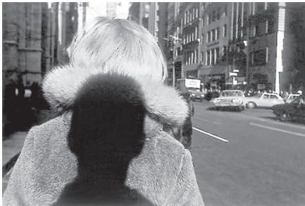
تصویر ۷- لی فریدلندر اخوندنگار، ۱۹۶۶.