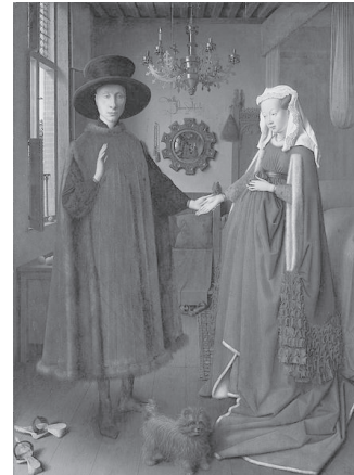
تصویر ۱- یان وان ایک الفینی و نوعر و سش، ۱۴۳۴ م. ماخذ: (Gardner; 2001; 577)

قراردادی دارد. اما پس‌ساخت‌گرایان می‌گویند دال اولاً ممکن است به چند مدلول دلالت کند و ثانیاً هر مدلولی دوباره در نقش دال به مدلول‌های دیگر دلالت می‌کند و لذا معنی مطلق و معینی وجود ندارد. بدین ترتیب بین دال و مدلول رابطه یکسویه و مطلق استوار نیست که اساساً فقط دال مهم و به اصطلاح همه‌کاره باشد (همان، ۱۸۵). آنان در نقد اثر هنری اولاً مؤلف را از صحنه اثر بیرون کرده‌اند و ثانیاً با طرح عدم قطعیت معنی، کار را به آنجا رسانده‌اند که می‌توان گفت به اندازه تعداد خوانندگان و مخاطبان اثر هنری احتمالاً معنا وجود دارد لذا خود متن هم در حاشیه قرار می‌گیرد و هر چه هست نظر مخاطب است.