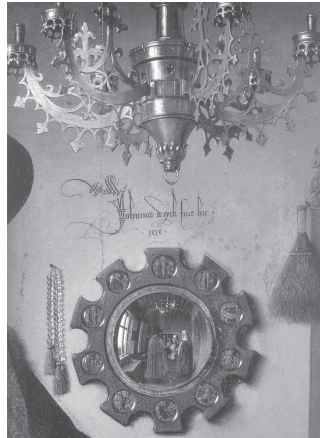
تصویر ۲- جزعی از تصویر ۱- امضای یان وان ایک در میانه اثر در بالای آیینه.