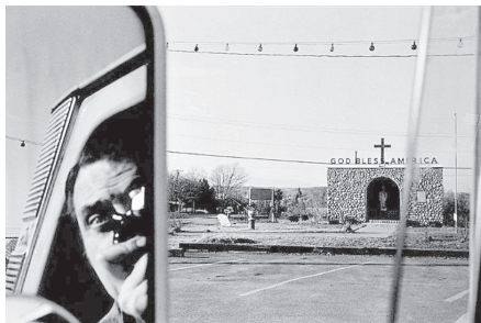
تصویر ۸- لی فریدلندر اخوندنگار، جاده غربی، نیویورک، ۱۹۶۷.

در این تصویر مشاهده می‌شود که مؤلف از خود سایه‌ای غیرمستقیم و مبهم باقی گذاشته است اما اگر همان سایه مبهم مؤلف حذف شود، به معنای متکثر تصویر آسیب خواهد رساند. به ویژه زیبایی ابهام در این متن را از بین خواهد برد متنی که به تعبیر بارت از نوع نویسا نیست زیرا به مخاطب اجازه می‌دهد لذت مؤلف بودن را تجربه کند و به متنی از نوع نویسنده نزدیک شود و مدام تعبیری جدید از عکس را مطابق فرهنگ و خوانش خود ارائه دهد. اما تمامی این لذت معناپردازی، مغایرتی با حضور سایه مؤلف ندارد بلکه در سایه مؤلف این معناسازی‌ها شکل می‌گیرد.