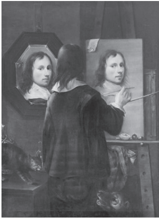
تصویر ۳- یوهانس گامپ اخودنگاره، ۱۶۴۶.