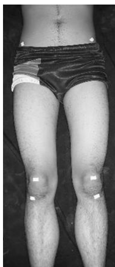
شکل ۲_ نمونه‌ای از تصاویر مورد استفاده برای محاسبه زاویه Q

اندازه‌گیری، لازم بود که تصاویر در شرایط کنترل شده‌ای از وضعیت نورپردازی و رنگ زمینه گرفته شوند. شکل ۲، نمونه‌ای از تصاویر مورد استفاده در این تحقیق را که در پس‌زمینه تیره گرفته شده است، نشان می‌دهد. در مراحل بعد با پردازش‌هایی موقعیت نشانگرها و در نهایت زاویه Q از روی تصویر مشخص می‌شود. مراحل پردازشی مختلف برای تعیین موقعیت نشانگرها و محاسبه زاویه Q به وسیله نرم‌افزار با ذکر جزئیات و شکل توضیح داده شده است.