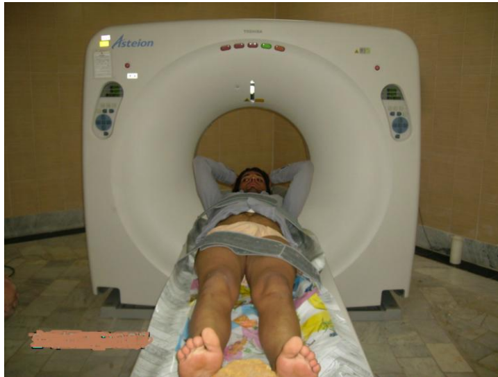
شکل ۱_ نمونه‌ای از شیوه تصویربرداری به وسیله دستگاه CT scan

در مرحله سوم، آزمودنی‌ها به محل انجام تست انتقال داده شدند و آزمودنی‌ها در حالت درازکش روی کف زمین با چهار سر ریلکس و زانوی کاملاً باز (۲۷)، پاها برهنه و مستقیم به بالا (۲۲) و یک اسفنج (به شکل دوزنقه) به طول ۱۲ سانتی‌متر بین دو قوزک داخلی پا و با پشت زمینه غیرمنعکس‌کننده قرار گرفتند، سپس در محل‌هایی که با ماژیک علامت‌گذاری شده بود، برچسب سفید نصب شد و آزمونگر در این حالت با استفاده از دوربین دیجیتال (Canon، ۵ مگاپیکسل)، که در نمای فوقانی از اندام تحتانی در ارتفاع ۱۵۰ سانتی‌متر از آزمودنی روی سه پایه به صورتی که لنز دوربین در راستای مرکز طولی ران قرار داشت، از آزمودنی‌ها عکس گرفت.