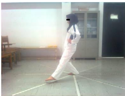
شکل ۲ - اندازه گیری تعادل پویا

طول پای افراد بر فاصله دستیابی آنها اثرگذار است. بنابراین میانگین فاصله دستیابی، به طول پای هر آزمودنی تقسیم و در عدد ۱۰۰ ضرب شد. متغیر وابسته، محاسبه شد و فاصله دستیابی به عنوان درصدی از اندازه طول به دست آمد (۶). طول پا از خار خاصه ای قدامی فوقانی تا قوزک داخلی با متر نواری اندازه گیری شد. به این منظور آزمودنی در وضعیت خوابیده به پشت قرار می گرفت، درحالی که زانوها در وضعیت اکستنشن قرار داشت و مچ پاها ۱۵ سانتی متر از هم فاصله داشتند (۲۷).