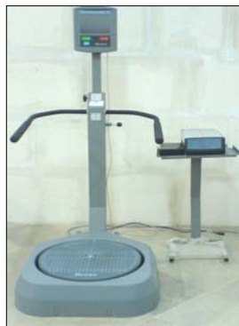
شکل ۱ - نمای کلی دستگاه و تغییرات انجام شده