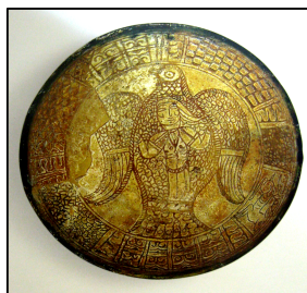
تصویر شماره ۳/ الف