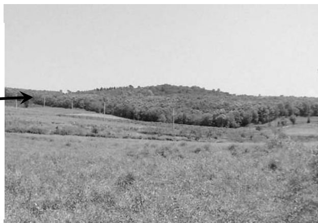
شکل ۱- موقعیت منطقه مورد بررسی در مازندران