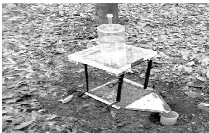
شکل ۲- چگونگی همانندسازی باران در کاربری جنگل مورد بررسی

گیاهان، لاشبرگ و سنگریزه‌های بزرگتر از ۴ سانتی‌متر پیش از هر همانندسازی باران جمع‌آوری شد (Duiker et al, 2001). پس از هر رخداد بارش، حجم روان‌آب با اندازه‌گیری مستقیم توسط استوانه مدرج تعیین شد (Marques et al, 2007). با ثبت فاصله زمانی آغاز بارش تا آغاز روان‌آب با کرنومتر، آستانه آغاز روان‌آب مشخص شد (Engel et al. 2009). پس از اندازه‌گیری حجم روان‌آب، میزان فرسایش پس از عبور دادن از کاغذ صافی وات‌من ۴۰، با آون در دمای ۱۰۵ درجه سلسیوس خشک و توزین شد. هم‌چنین از تقسیم میزان فرسایش بر حجم روان‌آب، غلظت رسوب بر حسب گرم در لیتر محاسبه شد (Kelarestaghi et al, 2009). در هر آزمایش همانندسازی باران از مجاورت هر قطعه، نمونه خاک سطحی (۲۰-۰ سانتی‌متر) برای تعیین عامل‌های مورد بررسی برداشت شد (Casermeiro et al 2004., Jordan & Martinez-Zavala, 2008). نمونه‌های