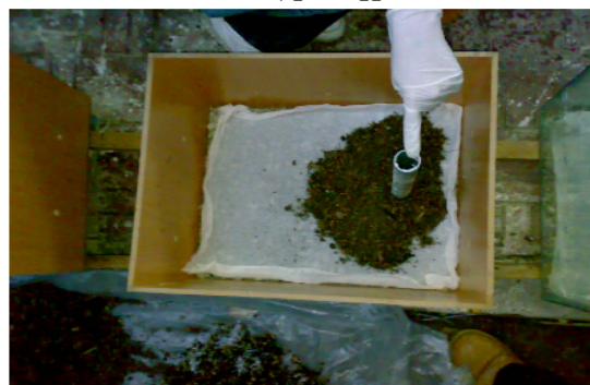
شکل شماره (۲): محفظه نگهداری در حال اضافه کردن مواد بستری