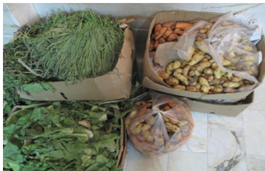
شکل شماره (۱): پسماندهای تهیه شده از میدان میوه و تره‌بار (خوراک کرم‌ها)

نگهداری کرم‌ها از جعبه‌های چوبی به ارتفاع ۳۰ سانتیمتر، عرض ۴۰ سانتیمتر و طول ۵۰ سانتیمتر استفاده شد (شکل شماره ۲). بر روی دیواره‌ها و کف محفظه‌ها، سوراخ‌هایی با قطر ۲/۵ سانتیمتر به منظور تبادل هوای بستر با محیط اطراف ایجاد شد. محفظه‌های نگهداری در طول مدت آزمایش (۷۵ روز)، در زیرزمین تاریک و مرطوب با دمای حدود ۲۵ درجه سلسیوس قرار داده شدند. رطوبت بسترها با اضافه کردن تناوبی آب در مواقع مورد نیاز، در طول آزمایش در محدوده ۶۵-۷۰ درصد ثابت نگه داشته شده بود (رستمی، نبی و اسلامی ۱۳۸۷). در ابتدای آزمایش، ۳۰۰ گرم مخلوطی از کرم‌های جوان و بالغ به محفظه‌های نگهداری که شامل بسترهای مختلف به همراه خوراک (پسماندهای آلی) بودند، اضافه شد.