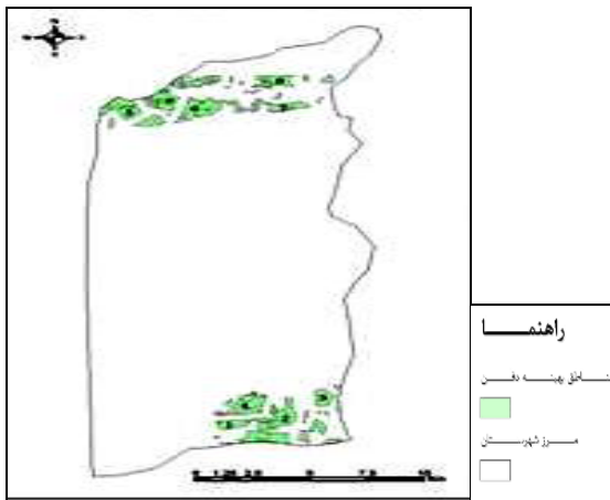
شکل شماره (۲): مناطق مطلوب، برای دفن مواد زاید جامد

ساده‌تری در می‌آورد (Ngai, 2003)، (Omkarprasad, 2004) و (Mau Crimmins, 2003). در مسئله مکان‌یابی محل دفن، هدف انتخاب محل مناسب برای دفن مواد زاید از بین چند گزینه (چند محل مشخص) است. معیارها و زیرمعیارها، شامل عواملی هستند که باعث ایجاد تفاوت در گزینه‌ها، (مانند عوامل مؤثر ژئومورفولوژیکی، فاصله از شهر و ...) می‌شوند. گزینه‌ها نیز محل‌های انتخاب شده برای دفن هستند (شکل شماره ۲).