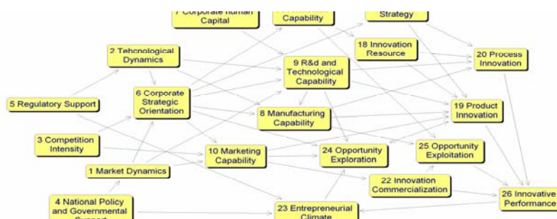
نمودار ۲. نقشه ادغامی اکثریت ۲