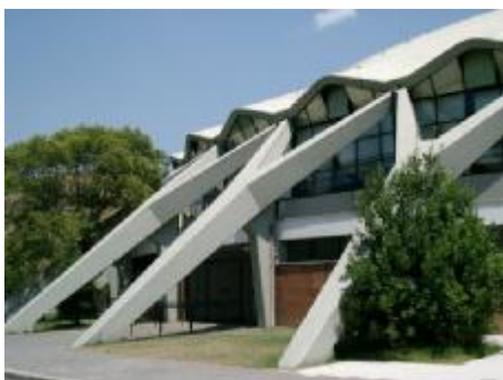
شکل ۱۰ سالن ورزش پلاز تولدو اسپرت در رم.