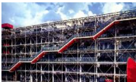
شکل ۶: مرکز فرهنگی ژرژ پمپیدو در پاریس.

تبادل نظر لازمه دستیابی به شرایط لازم برای یک همکاری موفق بین معمار و مهندس ساختمان است. مهندسیین باید رفتار و عکس العمل یک ساختمان را در شرایط متفاوت بارگذاری تحلیل نمایند. این مسئولیت، مهندسیین ساختمان را نسبت به سایرین یعنی کسانی که اطلاعات فنی لازم را ندارند و حساسیت نقش مهندسیین و مشکلات را بخوبی درک نمی نمایند، محافظه کار تر می کند. در ساختمان مرکز فرهنگی ژرژ پمپیدو ۱۳ در پاریس (شکل ۶) طراحی ریچارد راجرز و رنزو پیانو همکاری مشترک بین معمار و مهندس سازه و قرار گرفتن سازه در بیرون ساختمان سبب گردیده است حداکثر انعطاف پذیری در فضاهای داخلی ساختمان ایجاد گردد. در نتیجه می توان فعالیت های مختلف و نمایشگاه های متعدد را با حفظ خصوصیات هریک در آن برگزار نمود.