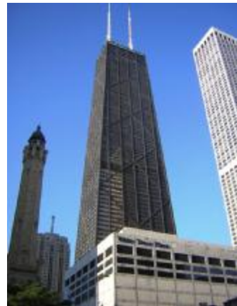
شکل ۴: ساختمان جان هنکاک در شیکاگو.

“... اگر سعی کنید تا بفهمید چه کسی هواپیمای کنکور را طراحی کرده است، چنین تصویری در ذهن شکل می گیرد که گروهی شامل صنعتگران، برنامه ریزان، ناظران و سازندگان آن را ساخته اند و اقتصاد آن نیز تحت کنترل مدیرانی است که افراد با تخصص های مختلفی را بکار می گیرند و در نهایت و آخر از همه طراحان را نیز شامل می شود. این تصویر بسیار عادی و بعضاً شبیه کاریکاتور نشان دهنده القاء این مطلب در ذهن بسیاری از انسان هاست که دنیای مهندسی در یک محیط انتزاعی و دور از معانی و مفاهیم واقعی گم شده است.”