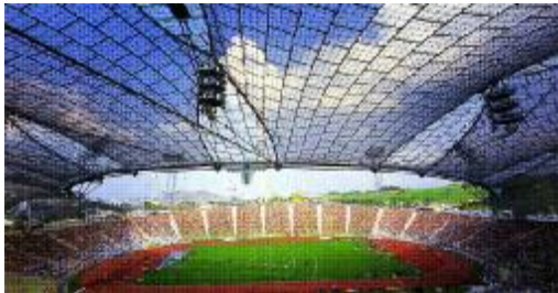
شکل ۲: استادیوم المپیک مونیخ.

وحدت در یک طرح به معنای هماهنگی، یک پارچه و منسجم بودن است و نه یک شی واحد بودن. تعریف وحدت در یک پل هوایی کوچک بسیار متفاوت است با تعریف آن در یک نیروگاه تولید برق. این ساختمان‌ها از اجزاء متفاوتی تشکیل می‌شوند که باید در راستای تحقق یک هدف معین قرار گیرند. چنانچه اجزاء یک طرح در راستای نیل به یک هدف مشخص طراحی شده باشند، وحدت در تمامی اجزای طرح قابل مشاهده خواهد بود. نوعی وحدت تصنعی نیز وجود دارد که باید از آن احتراز نمود. مجموعه‌ای از اجزاء غیرمتناسب، ناهماهنگ و ناموزون را ممکن است در کنار یکدیگر قرارداد ولی عدم دستیابی این مجموعه به یک هدف واحد نتیجه‌ای جز غیرقابل قبول بودن طرح به همراه نخواهد داشت. در استادیوم المپیک مونیخ (شکل ۲) از طراحی‌های فرای آتو ۷ اجزاء طرح در عین زیبایی دارای وحدت و یکپارچگی می‌باشند.