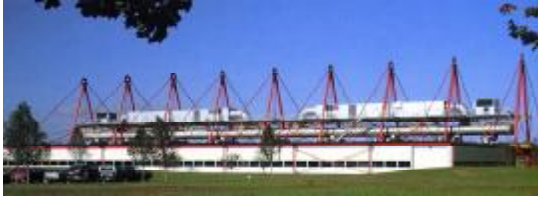
شکل ۱: ساختمان پت سنتر در پرینستون.