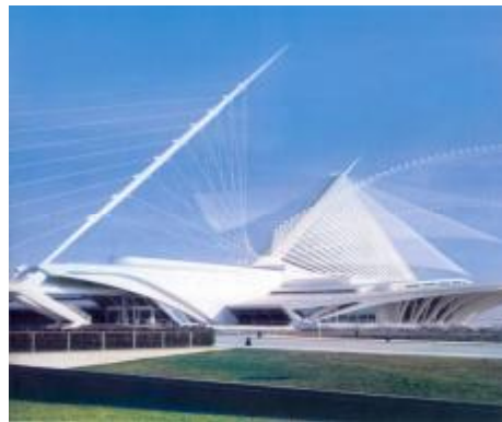
شکل ۳: موزه هنر میلواکی.

طراحی هوشمندانه و استثنایی موزه هنر میلواکی (شکل ۳) توسط سانتیاگو کالاتراوا در ویسکانسین، امریکا با ترکیبی خلاقانه از سازه‌های کششی، فرم‌های آزاد و سقف‌های دارای انحنا و ادغام آن با پل عابر پیاده کابلی پاسخی مناسب به معیارهای فوق‌الذکر و نشان دهنده بکارگیری صحیح اصول پایداری سازه و رفتار مناسب ساختمان در برابر نیروها همراه با رعایت اصل ضرورت در طراحی سازه و ساختمان می‌باشد. رعایت همین اصول و توجه به این معیارها در طراحی موزه هنر میلواکی علت اصلی موفقیت این طرح بوده است. طرحی که می‌تواند از نظر نوآوری با قصر بلورین ۸ طراحی جوزف پاکستون مقایسه شود.