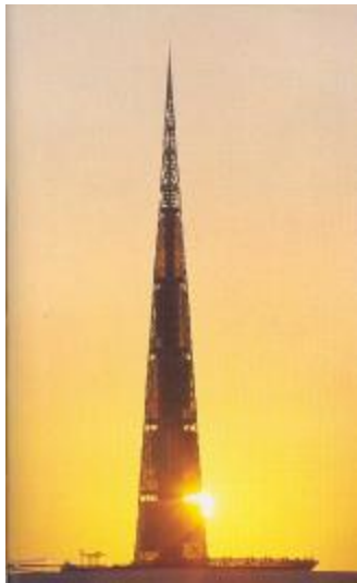
شکل ۸: برج میلینیوم.

تنها به یک رقابت تبدیل نخواهد شد بلکه معمار و مهندس پذیرای نقش واقعی یکدیگر در شکل‌گیری یک معماری خوب خواهند بود. نتیجه چنین تفکری بخوبی توسط نورمن فاستر در طراحی برج ۸۴۰ متری میلینیوم ۱۷ (شکل ۸) به کار گرفته شده است. در این طرح از سیستم لوله‌ای با شکل مخروطی و مهاربندی‌هایی در نمای بیرونی ساختمان برای پایداری در برابر نیروهای قائم و افقی استفاده شده است.