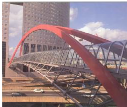
شکل ۷: پل ژاپن در پاریس.

طراحی پل ژاپن ۱۵ به دهانه ۱۰۰ متر در ناحیه لادفانس پاریس ۱۶ (شکل ۷) که توسط پیتر رایس که و با بهره‌گیری از یک فرم قوسی بدیع انجام شده است، به خوبی تاثیر بکار گرفتن این روش‌های عینی را در طراحی چنین سازه‌ای همراه با نوآوری و ابداع فرم‌های جدید نشان می‌دهد.