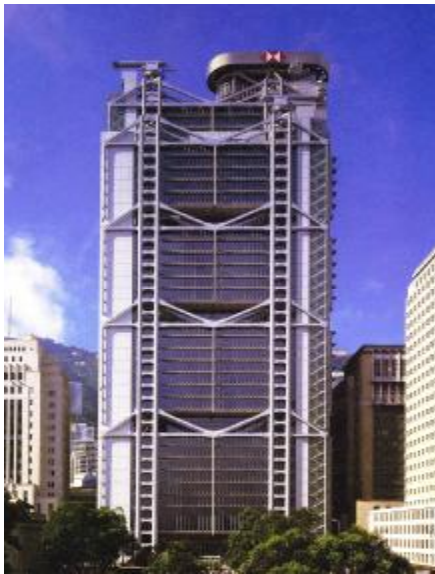
شکل ۹: ساختمان مرکزی بانک هنگ کنگ.