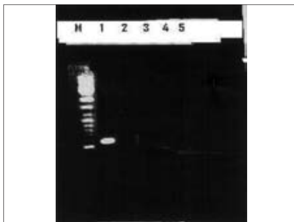
تصویر ۳- آزمایش PCR برای تشخیص کلاستر مایکوئیدس در نمونه‌ها و تکثیر قطعه ۵۴۸ bp در نمونه‌های مثبت. ستون M: مارکر DNA (MW marker ladder 100). ستون ۱: نمونه کنترل مثبت نمونه سویه (F38). ستون ۴-۲: تشخیص کلاستر مایکوئیدس در نمونه‌های بافتی. ستون ۵: آزمایش نمونه ریه با گونه آگالاکتیه (کنترل منفی).

و ۴۲۰ می‌کنند. که محل اثر آنزیم در جایگاه نوکلوتیدهای ۸۴۵ تا ۸۵۰ از rRNA 16S قرار دارد. اپرون rrnB در گونه M.ccp، بدلیل موتاسیون نقطه‌ای (A/G) فاقد جایگاه اثر آنزیم است، به همین دلیل سه باند ۵۴۸، ۴۲۰ و ۱۲۸ تشکیل می‌شود که جایگاه آن در محل دومین ژن نوکلئوتیدهای ۱۰۶۴ و ۱۱۵۵ است (۳). Pettersson (۱۹۹۸) در تحقیقی دیگر نشان داد که این آنزیم در گونه M.ccp، سه باند ۷۸۵، ۷۰۳ و ۸۲ با مکانیسم مشابه ایجاد می‌کند (۱۶). امادراین دوروش، به دلیل وجود rRNA هضم نشده (متعاقب اتصالات ناهمگون) از نظر تنوری، احتمال ایجاد الگوی مشابه M.ccp توسط گونه‌های دیگر در الکتروفوروز وجود دارد (۲۲). این امر موجب نتایج مثبت کاذب می‌شود. به همین علت، در این مطالعه به منظور کاهش نتایج کاذب، از گونه آگالاکتیه که در خارج از این کلاستر قرار دارد، به عنوان کنترل منفی استفاده شد.