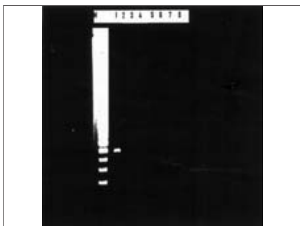
تصویر ۴- آزمایش PCR برای تشخیص گونه آگالاکتیه در نمونه‌ها و تکثیر قطعه ۳۷۵ bp در نمونه‌های مثبت. ستون M: مارکر DNA (MW marker ladder 100). ستون ۱: نمونه کنترل مثبت (نمونه واکسن آگالاکتیه). ستون ۷-۲: تشخیص گونه آگالاکتیه در نمونه‌های بافتی. ستون ۸: آزمایش نمونه ریه با گونه آگالاکتیه (کنترل منفی).