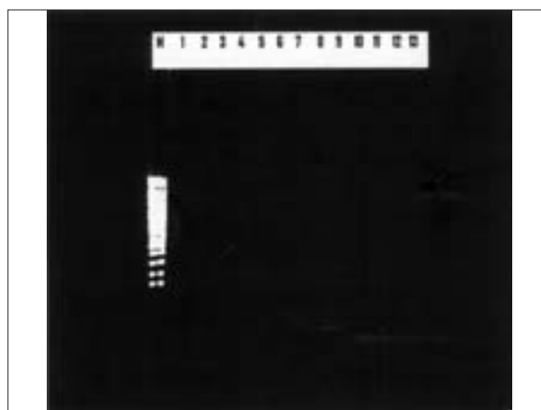
تصویر ۵- آزمایش PCR برای تشخیص گونه مایکوئیدس مایکوئیدس کلونی بزرگ در نمونه‌ها و تکثیر قطعه ۱۹۵ bp در نمونه‌های مثبت. ستون M: مارکر DNA (MW marker ladder 100). ستون ۱۲-۱: تشخیص کلاستر مایکوئیدس در نمونه‌های بافتی. ستون ۱۳: آزمایش نمونه ریه با گونه آگالاکتیه (کنترل منفی).

و ۴۲۰ می‌کنند. که محل اثر آنزیم در جایگاه نوکلوتیدهای ۸۴۵ تا ۸۵۰ از rRNA 16S قرار دارد. اپرون rrnB در گونه M.ccp، بدلیل موتاسیون نقطه‌ای (A/G) فاقد جایگاه اثر آنزیم است، به همین دلیل سه باند ۵۴۸، ۴۲۰ و ۱۲۸ تشکیل می‌شود که جایگاه آن در محل دومین ژن نوکلئوتیدهای ۱۰۶۴ و ۱۱۵۵ است (۳). Pettersson (۱۹۹۸) در تحقیقی دیگر نشان داد که این آنزیم در گونه M.ccp، سه باند ۷۸۵، ۷۰۳ و ۸۲ با مکانیسم مشابه ایجاد می‌کند (۱۶). امادراین دوروش، به دلیل وجود rRNA هضم نشده (متعاقب اتصالات ناهمگون) از نظر تنوری، احتمال ایجاد الگوی مشابه M.ccp توسط گونه‌های دیگر در الکتروفوروز وجود دارد (۲۲). این امر موجب نتایج مثبت کاذب می‌شود. به همین علت، در این مطالعه به منظور کاهش نتایج کاذب، از گونه آگالاکتیه که در خارج از این کلاستر قرار دارد، به عنوان کنترل منفی استفاده شد.