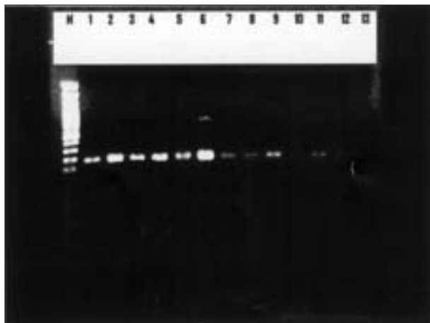
تصویر ۲- آزمایش PCR برای تشخیص جنس مایکوپلازما در نمونه ریه و تکثیر قطعه ۱۶۳ bp در نمونه‌های مثبت. ستون M: مارکر DNA (MW marker ladder 100). ستون ۱: نمونه کنترل مثبت (نمونه واکسن آگالاکتیه). ستون ۱۲-۲: تشخیص مایکوپلازما در نمونه‌های بافتی. ستون ۱۳: آزمایش نمونه ریه (کنترل منفی).