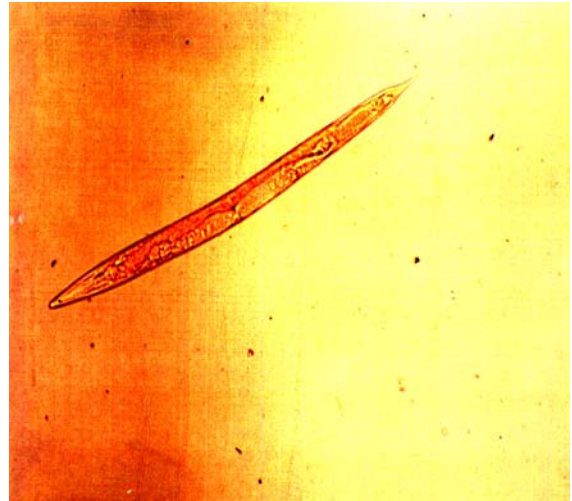
شکل ۵- لارو سن سوم نماتد H. bacteriophora (درشت نمائی × ۴۰) (عکس اصلی)

در اثر محلول‌پاشی قسمت تنه درختان آلوده در ۱۵ شهریور ماه (میانگین رطوبت نسبی ۴۲/۵٪ و درجه حرارت ۲۰/۹ درجه سانتی‌گراد) ۷۵/۹ درصد لاروها توسط نماتد Steinernema sp. و ۵٪ لاروها توسط نماتد Heterorhabditis sp. پارازیته شدند و نتایج در جدول ۲ درج شده است.