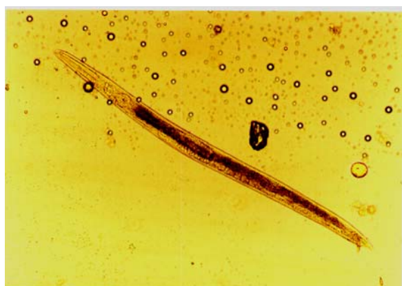
شکل ۴- نماتد نر جنس Steinernema sp. درشت نمائی \times 40 (عکس اصلی)

ناحیه مخرجی بدن بوده (شکل ۳)، ماده‌های تخمگذار و اغلب تعدادی از تخم‌ها را در محفظه تخم نگه می‌دارند، نرها کوچک‌تر از ماده بوده و در ناحیه انتهایی بدن دارای یازده جفت پاپیل تناسلی و یک پاپیل تناسلی دیگر به صورت منفرد می‌باشد. فاسمیدها غیر واضح و انتهایی دم گرد و یا نوک تیز می‌باشد. لاروهای سن سوم دارای فاسمید کوتاه و یا غیر مشخص می‌باشند و لاروهای دارای دم مخروطی بوده (شکل ۴) و کوتاه از طول مری می‌باشد (حدود ۶۵ درصد طول مری)، این جنس دارای هیجده گونه می‌باشد (۲۲).