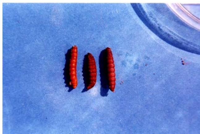
شکل ۱- لاروهای پارازیت شده پروانه موم خوار توسط نماتد H. bacteriophora

۲۳(۱۸)، عرض نماتد نر = (۳۸-۴۶) ۴۳ میکرومتر.