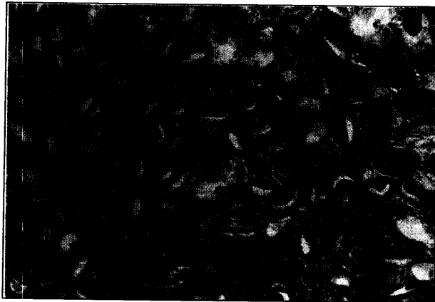
تصویر ۱ - توده‌ای از تخم کاپیلاریا هپاتیکا در کبد مریونس پرسیکوس صیدشده از شهرستان مشکین‌شهر رنگ شده به روش H&E (بزرگنمایی \times 1000 ).

واژه‌های کلیدی: کاپیلاریا هپاتیکا، مریونس پرسیکوس، پزودوتوبرکل.