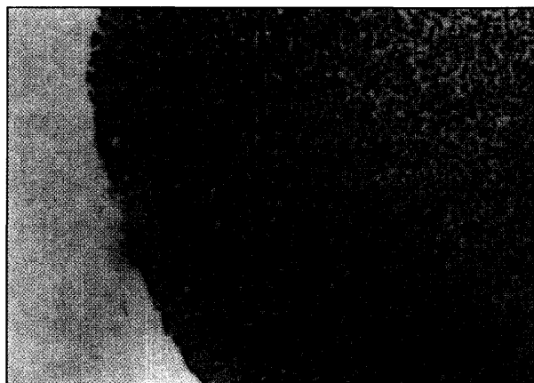
تصویر ۲ - E) تزیید بافت پوششی سنگفرشی (H&E × ۱۶۰).

Key words : Cyprinids, Carp pox, Histopathology, Viral hyperplasia, Epithelial tissue.