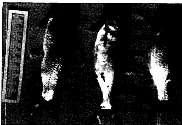
تصویر ۱ - برجستگیهای خاکستری رنگ روی سطح بدن و باله دمی.

ماهیان مبتلا از نظر بالینی فقط برجستگیهای خاکستری رنگ در سطح بدن نشان می‌دادند و هیچ‌گونه علایم غیرطبیعی دیگر مشهود نبود. در بررسی کالبدگشایی انجام‌شده اندامهای داخلی (کبد، کلیه، طحال، کیسه شنا، کیسه صفرا و روده‌ها) وضعیت کاملاً طبیعی داشتند و دستگاه گوارش حاوی مواد غذایی بود. در بررسی هیستوپاتولوژیک، تریزاید سلولهای سنگفرشی بافت پوششی، تشکیل بافت جوانه‌ای، نفوذ سلولهای آماسی به خصوص لنفوسیتها، پرخونی، گنجیدگی ائوزینوفیلیک داخل سیتوپلاسمی، دژنراسانس واکوتلی و بالونی در سلولهای بافت پوششی مشاهده گردید (تصاویر ۲، ۳، ۴). هیچ‌گونه تغییر ساختمانی در سلولهای عضلانی زیر بافت پوششی وجود نداشت. با توجه به ضایعات از نوع هیپرپلازی اپیدرم، گنجیدگی ائوزینوفیلیک داخل سلولی، گونه ماهیان مبتلا، زمان وقوع بیماری در فصل بهار (با گرم شدن هوا ضایعات کوچک شده و بتدریج محو می‌شدند)، بیماری آبله کپور ماهیان تشخیص داده شد.