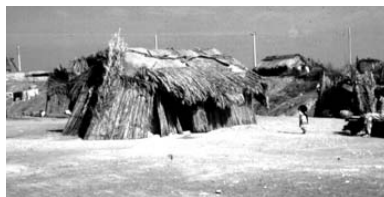
تصویر ۲- استفاده از ساخت مسکن با حداقل امکانات (سیستان و بلوچستان)