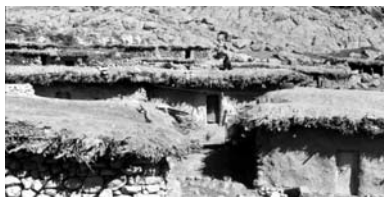
تصویر ۱- تکنولوژی ابتدایی مسکن بومی روستایی در مناطق عشایری بدلیل سابقه اسکان کم (استان کهگیلویه و بویر احمد)

شرایط نابسامان مناطق روستایی کشور در طول دهه های ۳۰-۲۰ شمسی و کمبودها و کاستی های موجود در این نقاط باعث شد تا دولت وقت به فکر تاسیس حوزه های عمرانی در مناطق روستایی برآید ۱ . در این برنامه که اولین برنامه توسعه کشور محسوب می شد مسکن روستایی مورد توجه ویژه قرار گرفت و به صراحت اعلام شد که یکی از مشکلات روستاها کیفیت نامناسب مسکن است. زوال و آسیب پذیری مسکن روستایی در آن زمان باعث شد تا توجه به ارتقاء کیفیت مسکن بعنوان یکی از نیازهای اساسی در اولین برنامه توسعه کشور مطرح گردد (تصاویر ۱ و ۲). مفاد این برنامه بر ایجاد تغییرات در مسکن و بهبود وضعیت آن و بهره مند شدن روستاها از خدمات آموزشی و بهداشتی و... اقدامات عاجل در این زمینه تاکید داشت. این برنامه که اولین برنامه توسعه در کشور محسوب می شد به خاطر وقایع ۱۳۳۰ و ۱۳۳۳ (روی کار آمدن دولت دکتر محمد مصدق، و جریانات مربوط به ملی شدن نفت، و کودتای امریکایی علیه دولت وی) و اتکاء بیش از حد به درآمدهای نفتی عملاً متوقف ماند و فرصت تحقق پیدا نکرد.