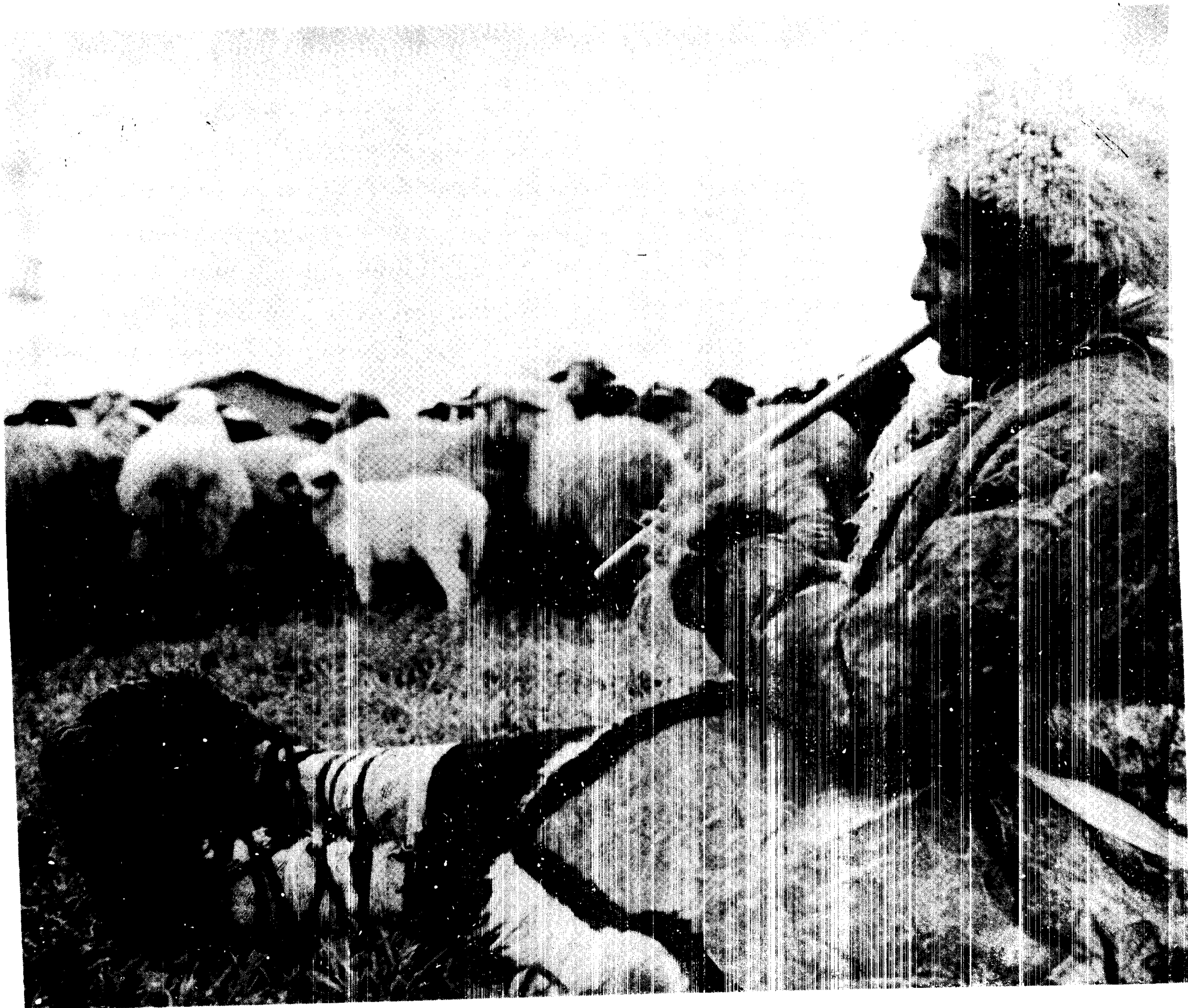
مرکز هماهنگی مطالعات محیط زیست