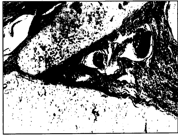
تصویر ۱- انتهای دو دیواره غضروفی در مجاورت هم قرار گرفته و در محل نقص غضروفی بافت همبند متراکم قرار دارد. غدد و وریدهای غاری در زیر محل نقص دیواره غضروفی مشاهده می شوند. رنگ آمیزی H&E. درشت نمایی ۴۰x.