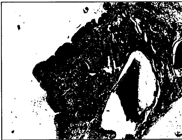
تصویر ۲- چین اپی تلیالی که بداخل لومن عضو برآمده شده و در زیر این ناحیه عروق خونی با اندازه های متفاوت و غدد مشاهده می شوند. رنگ آمیزی H&E. درشت نمایی ۴۰x.