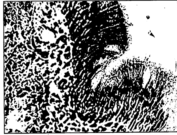
تصویر ۳- بافت پوششی استوانه ای مطابق کاذب مزه دار حاوی سلولهای جامی شکل در دیواره جانبی لومن عضو و مرونزال. رنگ آمیزی H&E. درشت نمایی ۴۰۰x.

آن ارایه شده است (۲۰۷،۱۲). در یک بررسی که با تصویربرداری از VNO انسانها به روش ("MRI" Magnetic Resonance Imaging) همراه بود نشان دادند که مجرای عضو به صورت یک ساختمان لوله ای شکل با میانگین طول ۷ میلی متر (از ۳ تا ۲۲ میلی متر) می باشد و از نظر شکل و اندازه و موقعیت عضو، در انسان دارای تفاوتی قابل ملاحظه ای است (۲).