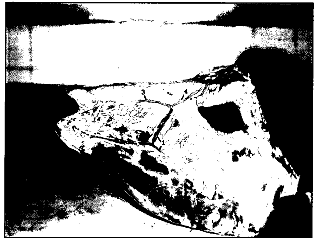
تصویر ۲- وریدهای سطحی سر گاومیش قبل از برداشت عضله جلدی صورت - نمای جانبی ۱- ورید صورتی ۲- ورید لبی فک فوقانی سطحی ۳- ورید پشتی بینی ۴- ورید زاویه چشم