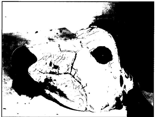
تصویر ۴- وریدهای عمقی سر گاومیش، قبل از برش فک پایینی - نمای جانبی ۱- ورید وداج خارجی ۲- ورید گوش خلی ۳- ورید زبانی صورتی ۴- ورید فک فوقانی ۵- ورید گیجگاهی سطحی ۶- شاخه ورید گیجگاهی عمقی با سینوس وریدی عمقی صورت همدانهایی پیدا می کند ۷- سینوس وریدی عمقی صورت. ۸- ورید عمقی صورت ۹و۳- ورید صورتی ۱۰- ورید لبی فک پایینی عمقی ۱۱- ورید لبی فک فوقانی عمقی ۱۲- ورید لبی فک فوقانی سطحی ۱۳و۱۵- سورید پشتی بینی ۱۴- ورید جانبی بینی ۱۶- ورید زاویه چشم

می گردد. پس از این ورید گیجگاهی سطحی، ورید گوش عمقی می دهد ورید پلکی فوقانی جانبی، شاخه دیگری از ورید گیجگاهی سطحی است که قسمت پلکها را زهکش می کند. ورید شاخ در قاعده شاخ دورترین انشعاب این ورید است. در انتهای انشعاباتی از ورید گیجگاهی سطحی در مشروب کردن عضله گیجگاهی شرکت می کنند (تصویر ۲).