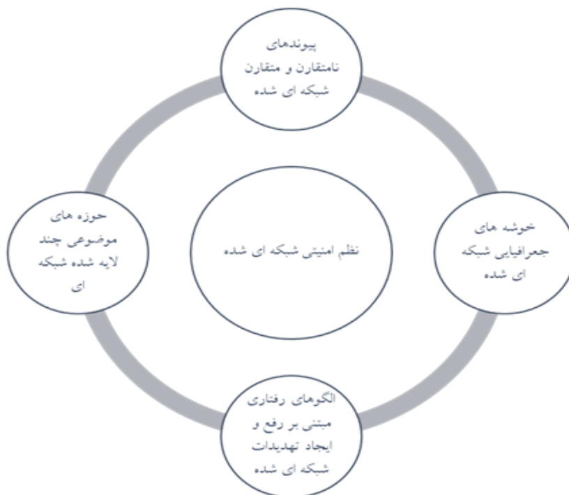
شکل ۱: اجزا و ویژگی‌های شبکه نظم امنیتی